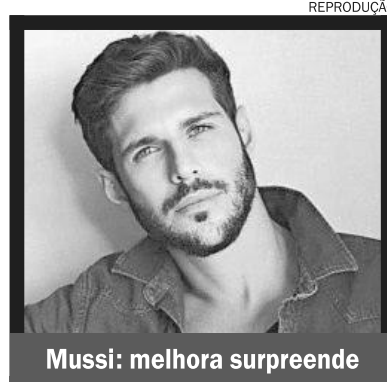
Mussi: melhora surpreende

A melhora impressiona quem o acompanha de perto, embora Mussi ainda não