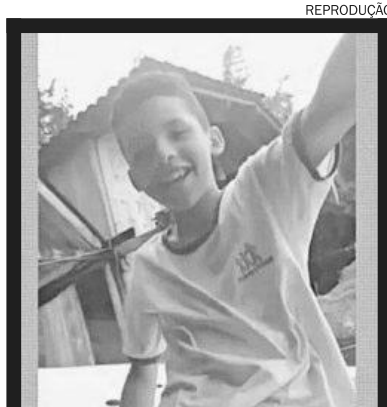
Dorqueu tinha 12 anos

O corpo da criança chegou a Paraty no começo da noite de sábado e foi direto para a Capela Municipal da